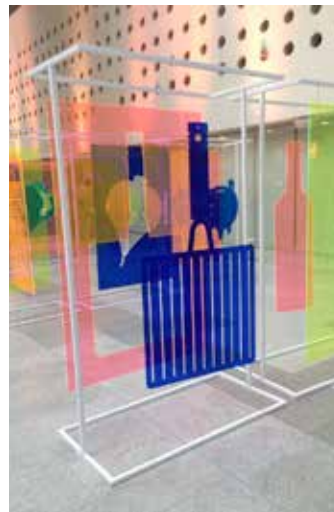
Hall de la muestra