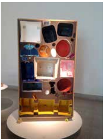
FOSSILE MODERNO 2004 - Meritalia