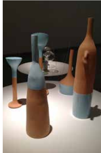
THE LANKIES´S FAMILY 2012 Producción Independiente