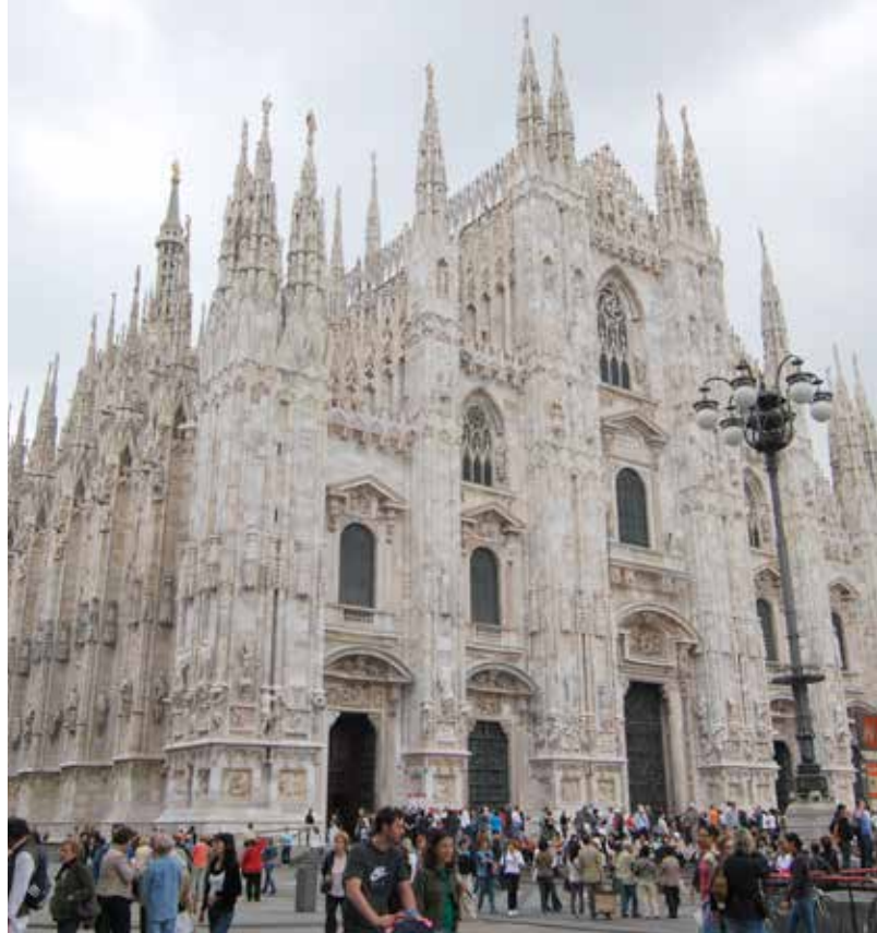
Catedral de Milán

Se arma una exposición para compartir lo creado, cuidando de que esta no sea solamente