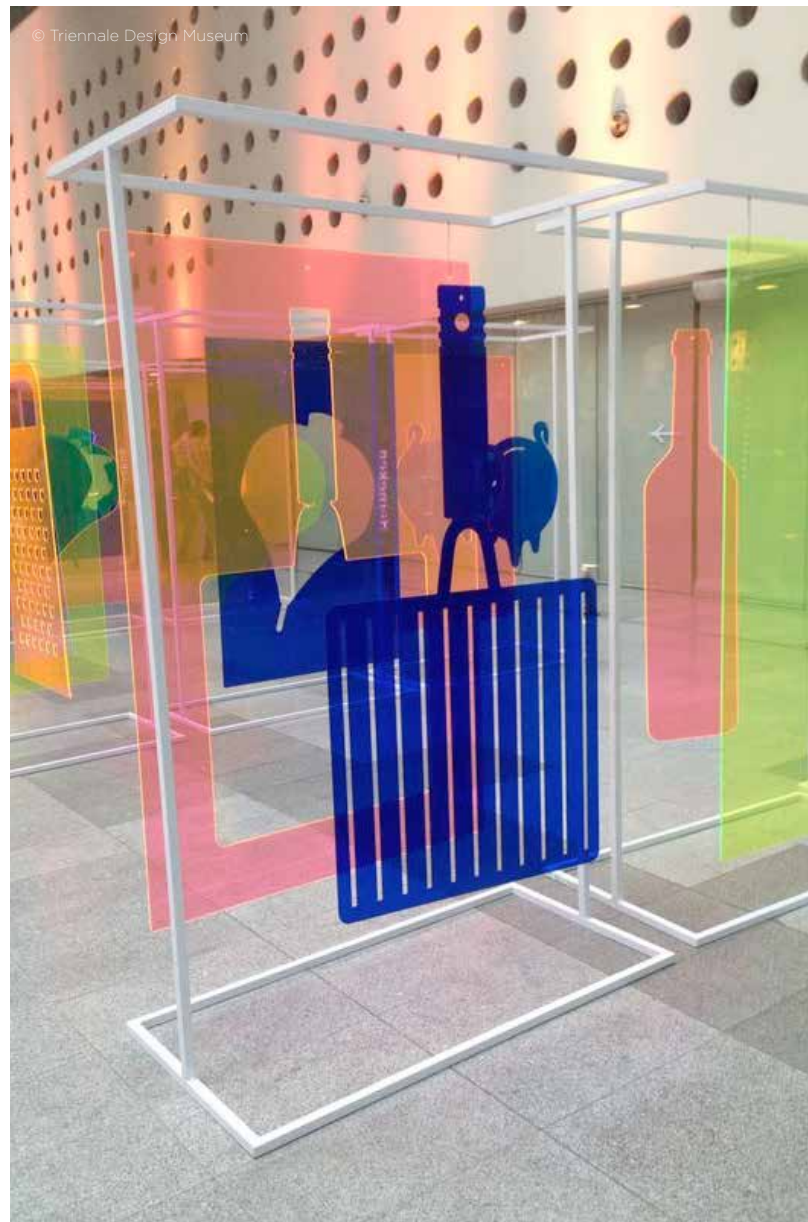
Hall de la muestra

A continuación situar a los/as niños/as de