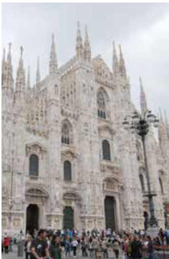
Catedral de Milán