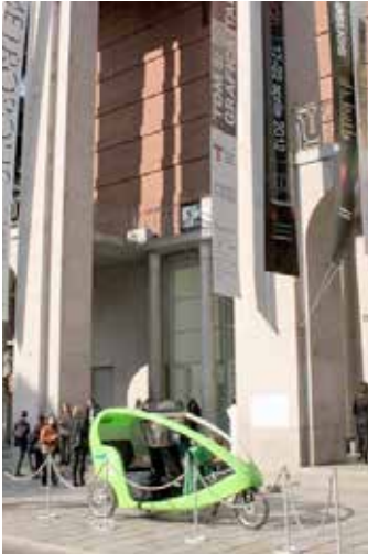
Museo Triennale de Milán