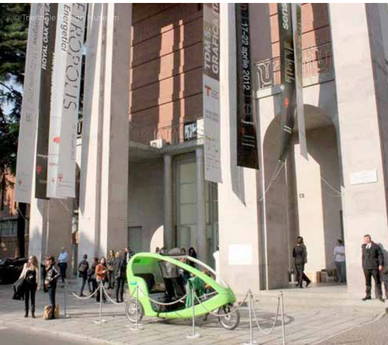
Museo Triennale de Milán

En la exposición El Nuevo Diseño Italiano, el espectador encontrará representados gran parte de los ámbitos y tipos de diseño que se reconocen en la actualidad, desde los más tradicionales como el diseño de mobiliario, iluminación, interiores, objetos, productos, joyas, y gráfico; hasta muy novedosos como el “Food design” o diseño de alimentos, el diseño de investigación y aquel en que parece primar más la forma que la función. Para complementar la información acerca de este tema, el/la docente puede consultar el Glosario que se encuentra al final de este cuaderno y los múltiples recursos de apoyo del minisitio correspondiente a la exposición en: