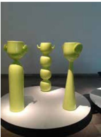
GIOTTO, MAX Y RENÉ 2006 - Euro3plast