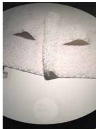
MAT-WALK 2002- Droog Desing