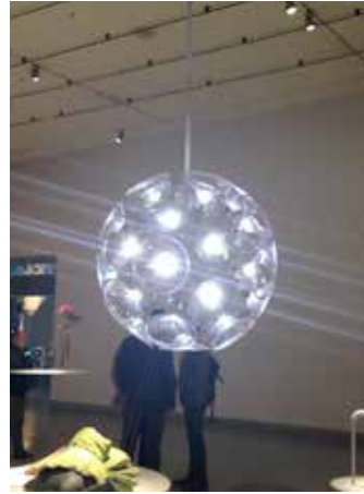
DANDELION 2006 - Tecnodeltai