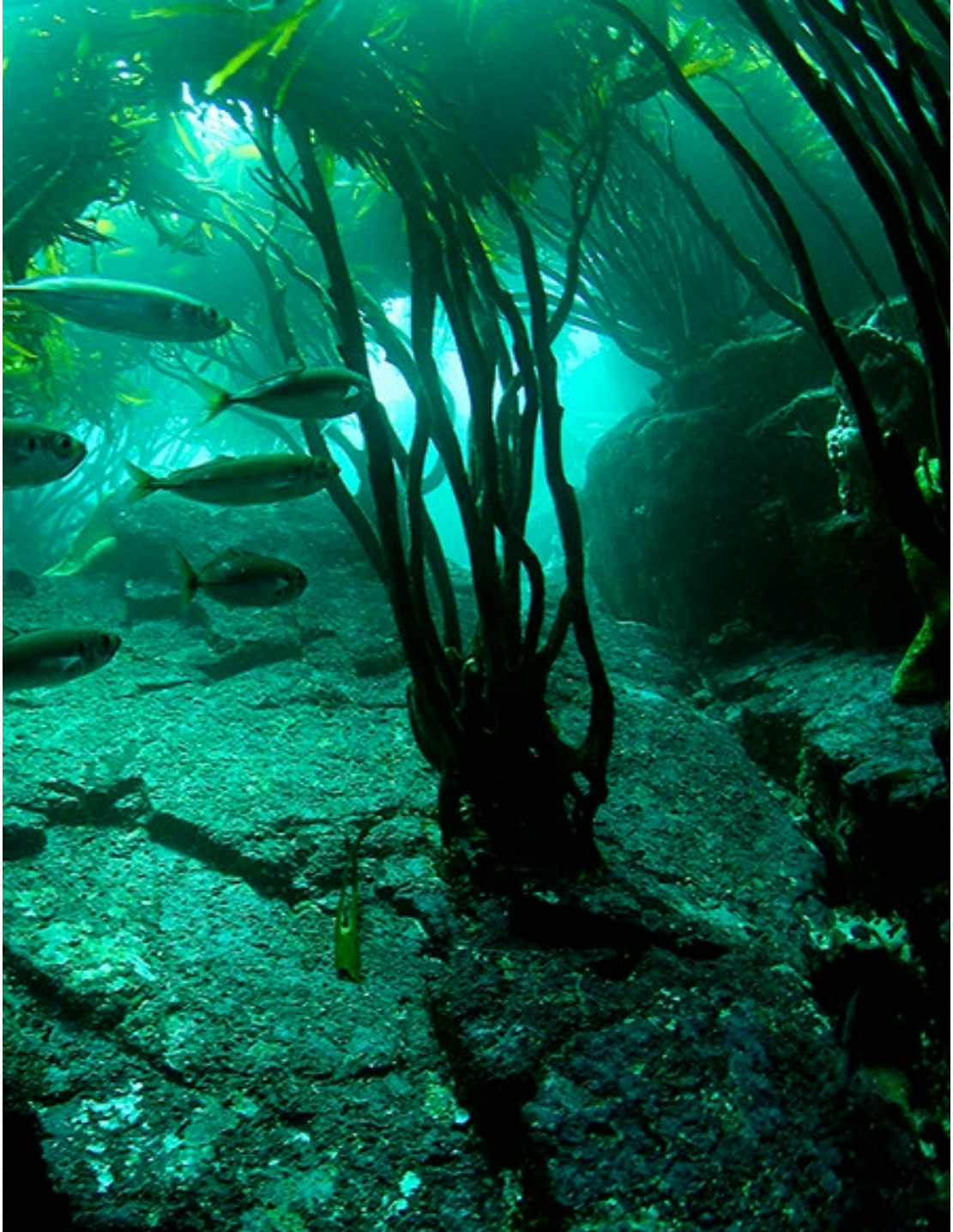
© César Villarroel / Fundación Meri César Villarroel. Bosque de algas Huiro Palo, Lessonia trabeculata , 2015. Cortesía Fundación Meri.

Imágenes ampliadas para utilizar con los y las estudiantes: