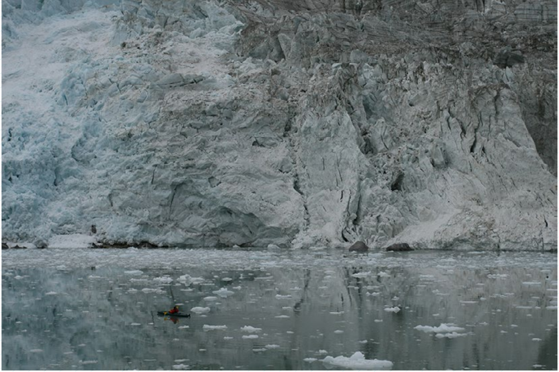
© Cristián Donoso Cristián Donoso. Aproximación a los pies del glaciar Pía, 2011. Cortesía del artista.