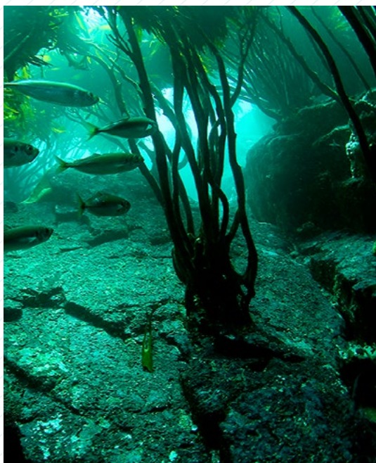
© César Villarroel / Fundación Meri César Villarroel. Bosque de algas Huiro Palo, Lessonia trabeculata, 2015. Cortesía Fundación Meri.