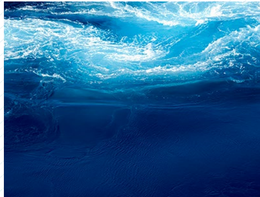
Denise Lira-Ratinoff. 14:05:10 Water 06, from the series Oceans, 2009.