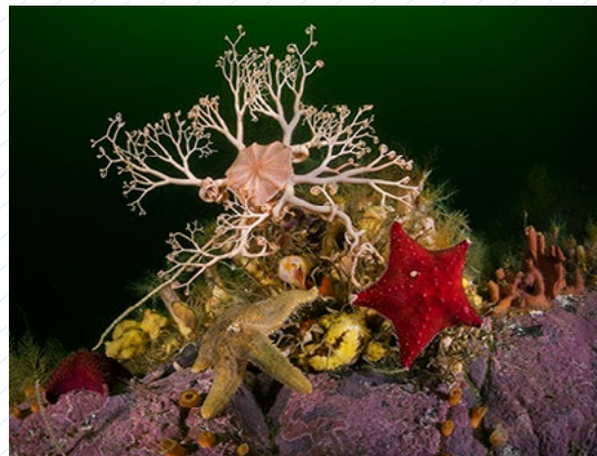
Eduardo Sorensen. Gorgonacefalo y estrellas de mar, 2017.