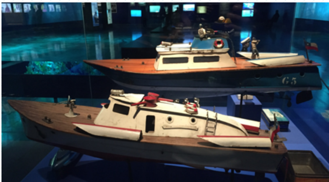
Fábrica de Juguetes Guillimar. Lancha torpedera propulsada por banda elástica, 1965. Colección Museo del Juguete Chileno.

Con esa información, se sugiere que el docente fomente en el grupo la reflexión en torno a la transformación de los juguetes a través del tiempo. Por ejemplo, hace algunos años era muy común divertirse con juguetes como: