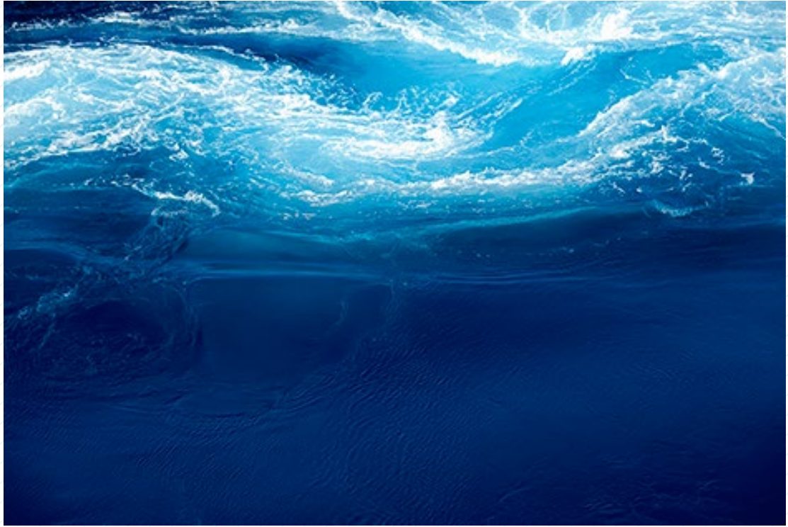
Denise Lira-Ratinoff. 14:05:10 Water 06, from the series Oceans, 2009.