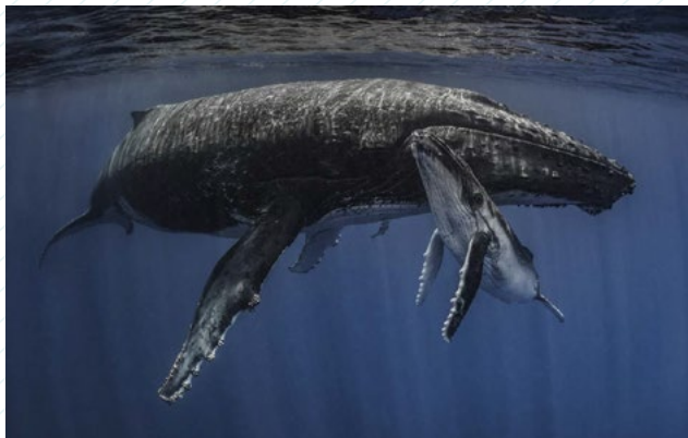
© Pilar Undurraga Pilar Undurraga. Hola Humana, 2017. Cortesía de la artista.

Durante el recorrido mediado por la exposición Ballenas, voces del mar de Chile, niñas y niños realizarán un viaje de exploración por los misterios que esconden los océanos. Compartiremos la historia de Mailen, una pequeña muñeca que hace muchos años viajó por los ríos del sur del país y se sumergió en el Océano Pacífico. En este viaje, descubrió cientos de tesoros que nos acercan a la historia de Chile, y un universo de seres que habitan nuestro mar. Así, Mailen conoce a la ballena azul, el habitante más grande del planeta, quien le presentará las formas de vida de los cetáceos, sus migraciones, nados, dietas y los cantos que realizan para comunicarse.