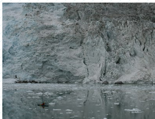
© Cristián Donoso Cristián Donoso. Aproximación a los pies del glaciar Pía, 2011. Cortesía del artista.