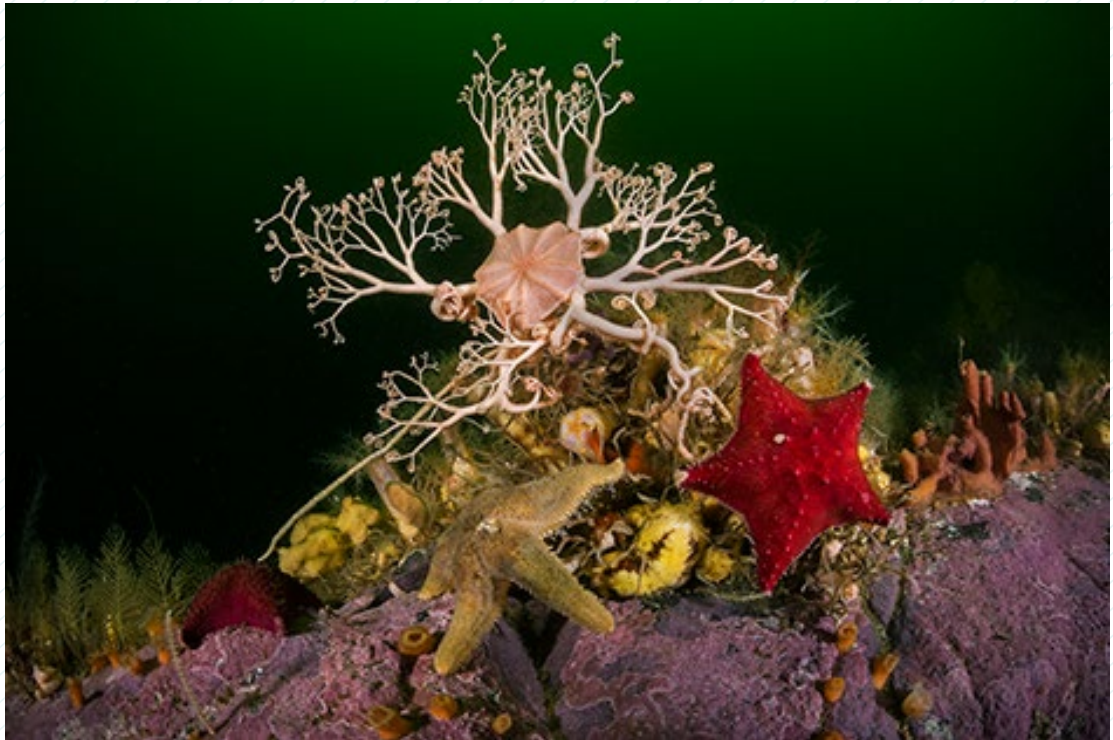
© Eduardo Sorensen / Fundación Meri Eduardo Sorensen. Gorgonacefalo y estrellas de mar, 2017. Cortesía Fundación Meri.