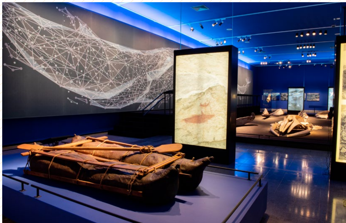
Exposición "Ballenas, voces del mar de Chile". Centro Cultural La Moneda.

Durante la visita mediada, las y los estudiantes participarán de un recorrido que les entregará señales sobre los modos de habitar de nuestras culturas originarias en relación al mar y las zonas costeras. Al rescatar narrativas y diversos aspectos del buen vivir, se busca dar un giro hacia una relación más cuidadosa, solidaria y espiritual con el planeta. Las culturas originarias de todo el país poseen sabidurías y sensibilidades sobre las interdependencias humano-naturaleza, la gestión ambiental, la vitalidad del mundo natural, la solidaridad comunitaria y el respeto