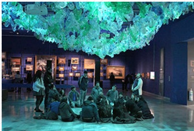
Exposición "Ballenas, voces del mar de Chile". Centro Cultural La Moneda.

elviaje@centroculturallamoneda.cl o al teléfono 223556558.