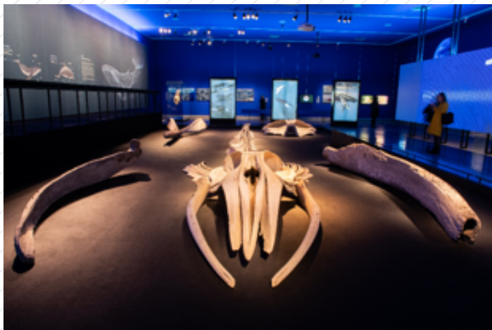
Exposición "Ballenas, voces del mar de Chile". Centro Cultural La Moneda.

El viaje. Escuelas y comunidades , es el programa de vinculación con el territorio del Centro Cultural La Moneda. Esta herramienta se inscribe en la vocación de nuestra institución por contribuir en el desarrollo de una cultura y educación de calidad para todos, generando desde el encuentro y el diálogo, instancias nutritivas para la reflexión y disfrute de las artes y el patrimonio.