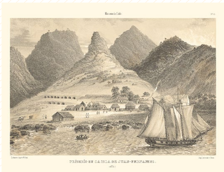
© Colección Biblioteca Nacional. Claudio Gay. Atlas de la historia física y política de Chile, Volúmen II, 1854. Colección Biblioteca Nacional.

Durante los siglos XVIII y XIX, exploradores europeos se aventuraron en nuestros mares observando, clasificando, nombrando y registrando nuevos y misteriosos seres y fenómenos. En estos largos viajes hacia lo desconocido pudieron encontrarse con varios cetáceos, como la ballena franca, el cachalote y la ballena austral, además de una gran diversidad de otras especies. También se encontraron con habitantes de nuestras tierras, comunidades indígenas que vivían en cercanía con el mar y sus ballenas, inspiraciones de sus cosmovisiones y elementos claves de su subsistencia.