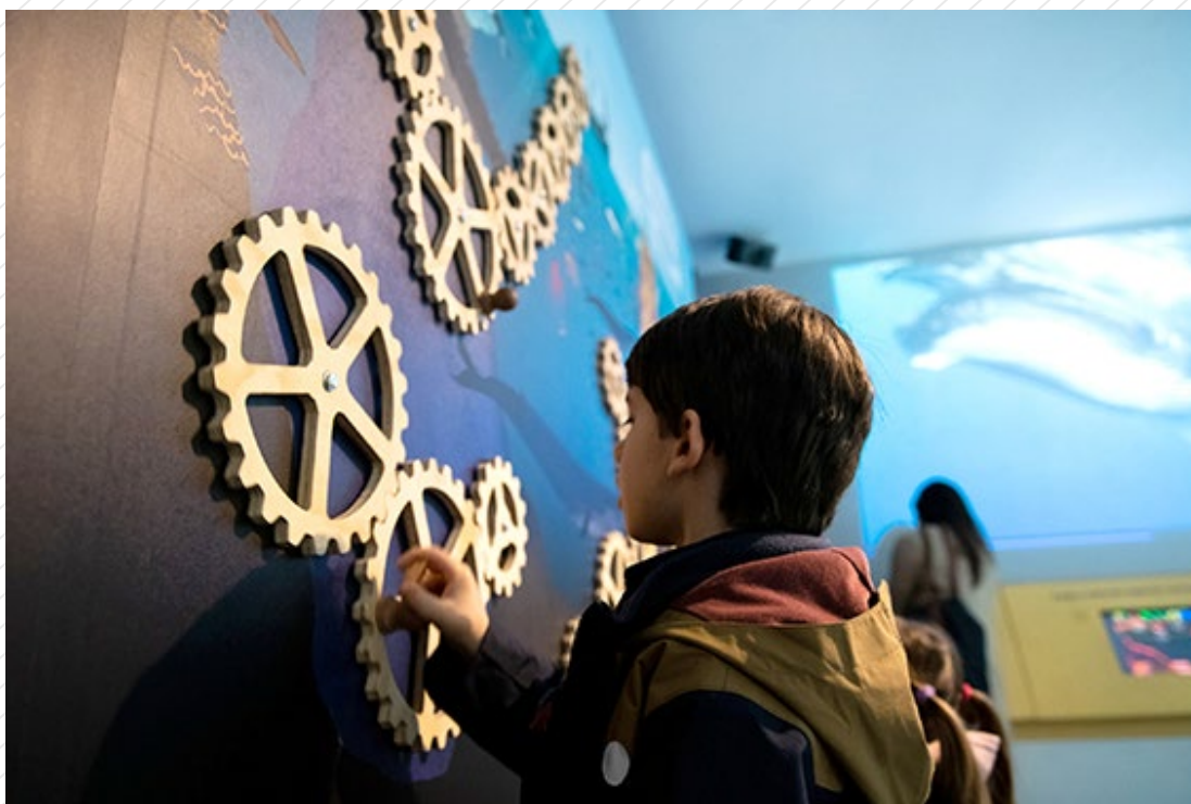
Exposición "Ballenas, voces del mar de Chile". Centro Cultural La Moneda.

Infórmate de toda la programación del Centro Cultural La Moneda a través de http://www.ccplm.cl/sitio/