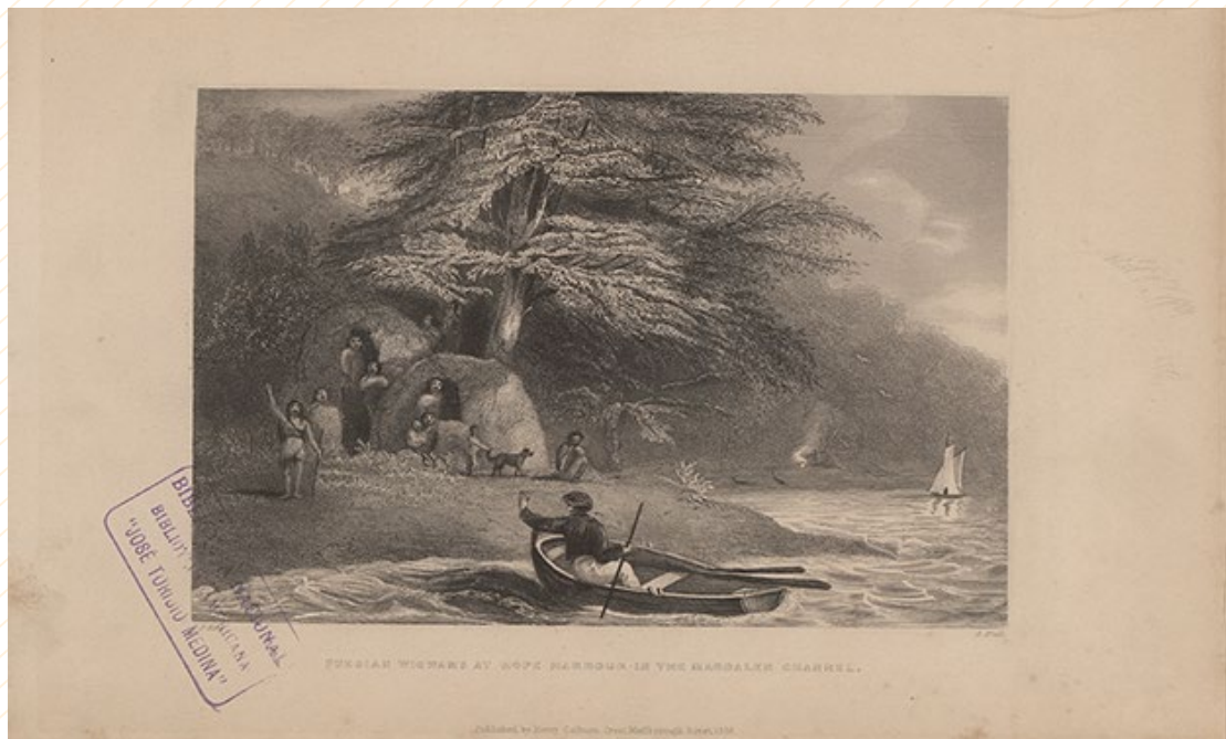
© Colección Biblioteca Nacional. Robert Fitz-Roy / Charles Darwin. Narración de los viajes topográficos de los barcos Adventure y Beagle entre 1826 y 1836 que describe su examen de las costas del sur de América del Sur y la circunnavegación de los beagles del mundo, 1839. Colección Biblioteca Nacional.