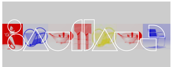
Logotipo Bauhaus por Werner Fett.

¿Cuáles crees que son las necesidades más relevantes para vivir en la actualidad?