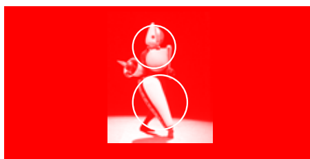
Estudio para logotipo de Bauhaus por Werner Fett.

Dos elementos centrales de esta escuela son la FORMA , expresada a través de estructuras regulares o irregulares en objetos producidos por las personas o la naturaleza, y el COLOR , a través del cual es posible comunicar movimiento y emociones.