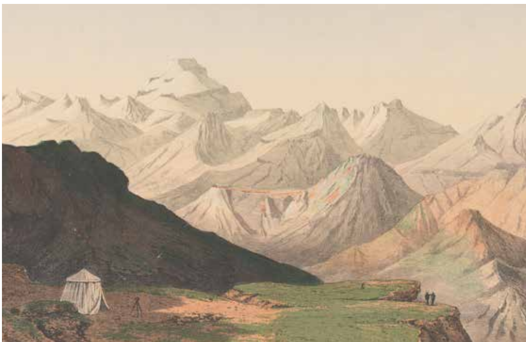
Cordilleras del Aconcagua Lámina del Atlas de la geografía física y política de Chile