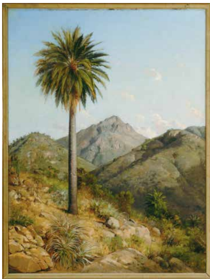
Gran Palma Onofre Jarpa Óleo sobre tela, 120 x 90 cm Colección Banco Central de Chile

las obras Gran Palma de Onofre Jarpa (s/f) y Palma 032 de la serie Cuasi Oasis de Sebastián Mejía, (2012). Pedir que observen ambas y preguntar: ¿Por qué se habrán puesto juntas estas obras si son tan diferentes? ¿Cuáles son los puntos de encuentro? ¿En qué época se habrá realizado cada una? ¿A qué se parece el marco de la fotografía de la cascada? (una puerta, una ventana, una caja fuerte, otra) Esperar un momento las respuestas y pedir a los/as niños/as que digan los sentimientos que cada obra les provocan (naturaleza, abierto,