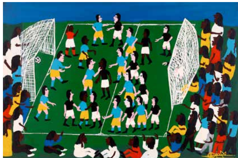
Discussão em campo [Discusión en la cancha] Ozias, 1998 Colección Museo Internacional de Arte Naif de Brasil

Al inicio, nos encontraremos con escenas y elementos del Brasil y sus territorios, sus historias, que son múltiples y diferentes, como la antigua esclavitud, paisajes amazónicos y otros. Que nos encaminan y entregan el contexto necesario para observar la vida cotidiana y la ciudad, que se manifiesta a través de bellos objetos y utensilios de la vida diaria que realzan los sabores, olores y quehaceres