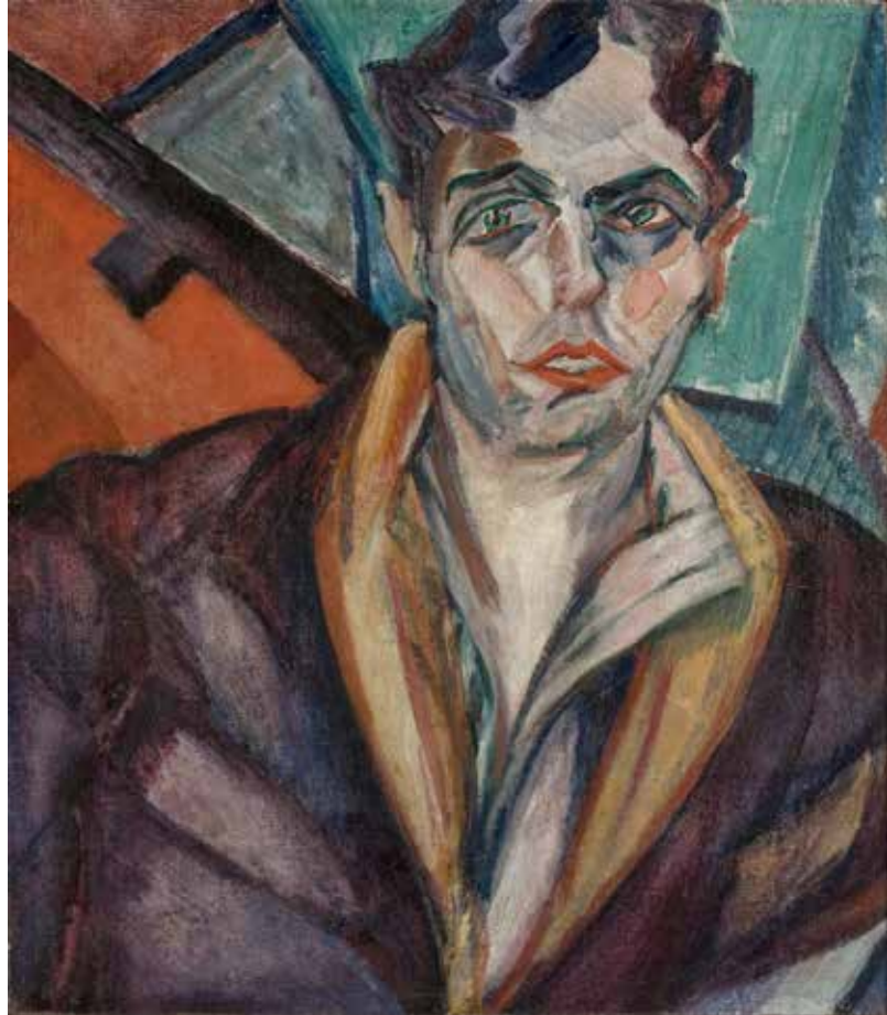
Retrato do Escritor Oswald de Andrade (1893-1945)

También en el Brasil de las primeras décadas del siglo 20, los artistas abordaron nuevos problemas sobre la representación, lo que llevó a la transformación del lenguaje artístico y a un quiebre con la tradición. El surgimiento de la fotografía y del cine, ambos lenguajes que capturar la realidad aún mejor que la pintura, contribuye a fomentar nuevas