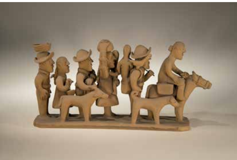
Familia de Retirantes [Familia de Migrantes] Família Vitalino, 1970 (cerca) Alto do Moura, Caruaru, Pernambuco Colección Museo del Folclor Edison Carneiro

Las dinámicas territoriales que se ejercen entre las ciudades y los espacios rurales, o entre el centro y la periferia, están fuertemente marcadas en Brasil. Si bien podemos decir que es un país fundamentalmente urbano y de grandes metrópolis, existe un Brasil también muy importante conformado por las sociedades rurales, y son éstas las que determinan el imaginario brasileño, fundamentado en el desarrollo agropecuario y minero, en relación al cual el territorio es una base fundamental.