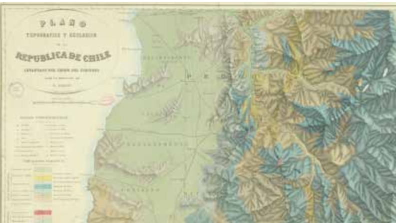
Plano topográfico y geológico de la República de Chile [mapa]: levantado por orden del Gobierno

Para realizar un paralelo con la cartografía actual y cómo esta es utilizada en muchos ámbitos de la vida cotidiana , el docente puede preguntar: si queremos llegar a un lugar que desconocemos ¿Cómo nos ubicamos en la actualidad? ¿Uds. han realizado algún mapa? Si es así ¿De qué se trataba el mapa que hicieron? En la actualidad podemos realizar mapas para representar diferentes tipos de información ¿Conocen algún mapa que represente un tema fuera de lo común?