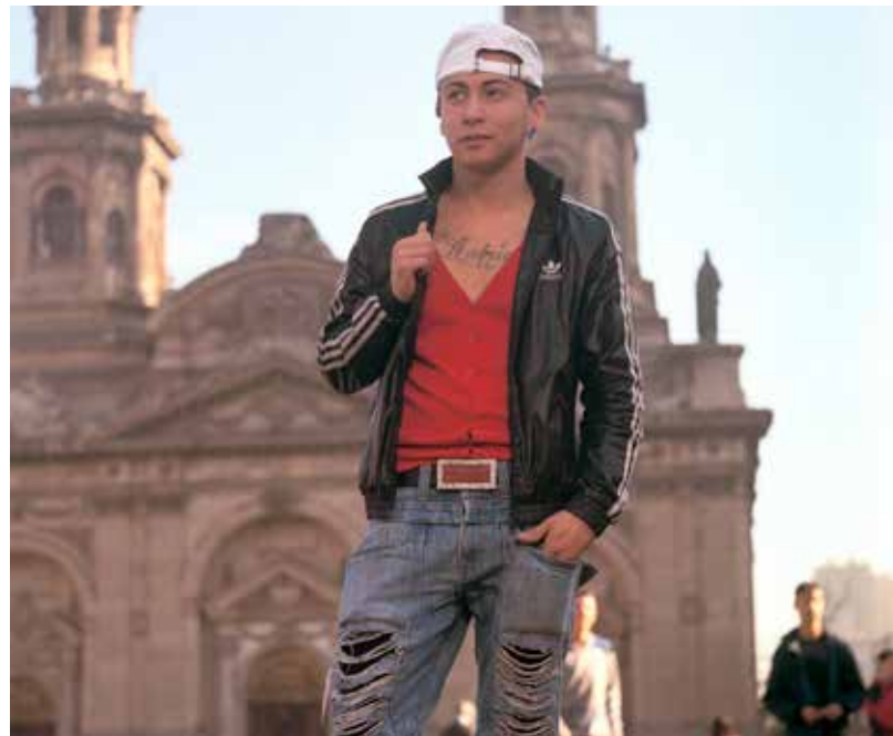
De la serie Maicol y sus amigos

y diferencias entre su propuesta y las de sus compañeros/as. El/la docente concluye que la significatividad es la clave de las diversas representaciones de paisaje que hacemos las personas.