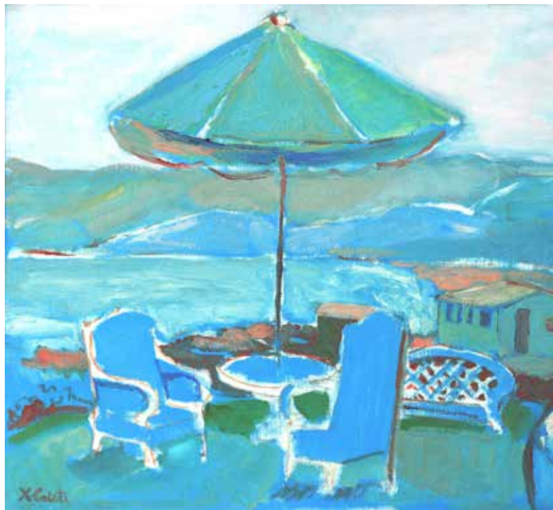
Hostería - Duao

Posteriormente el profesor expone algunas imágenes de la muestra.