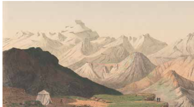
Cordilleras del Aconcagua Lámina del Atlas de la geografía física y política de Chile

Grabado por Narcisse Desmadryl París: Ch. Chardon, 1 atlas, Colección Museo Histórico Nacional