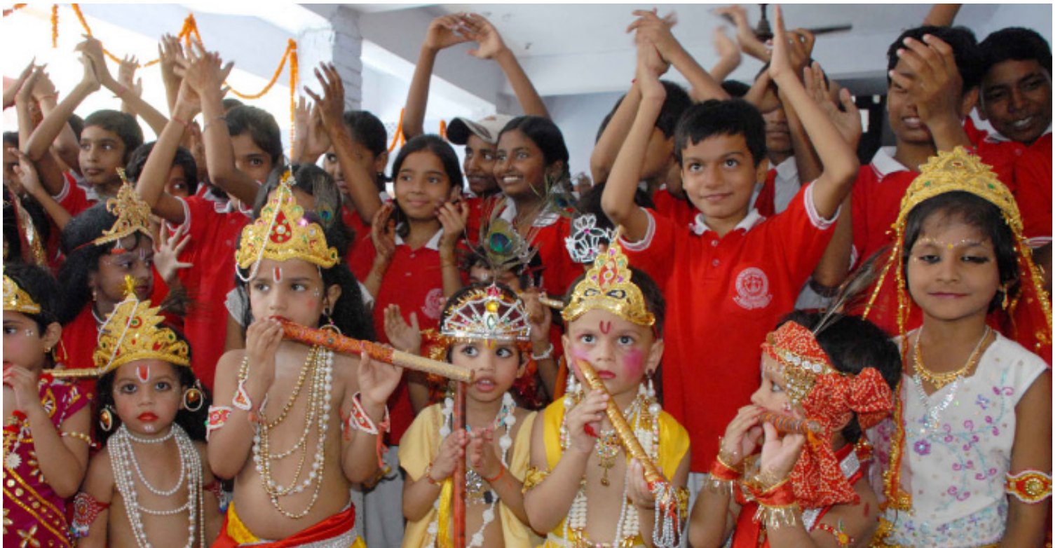
Niños Indios disfrazados de Krishná, avatar de Vishnú. Blog View Patna Yarpur Montessori School Kids