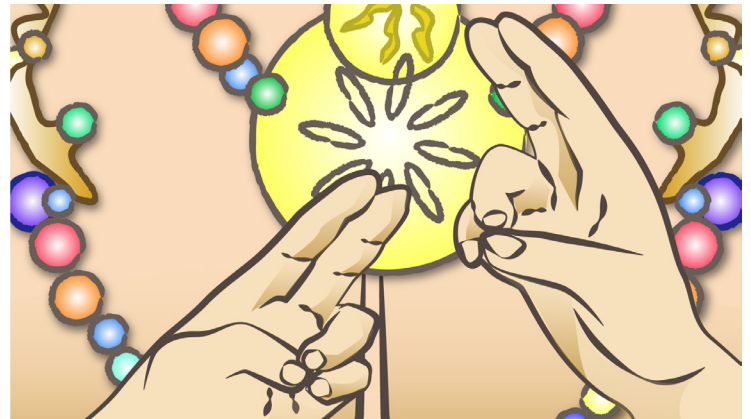
Pran Mudra o Mudra de la vida