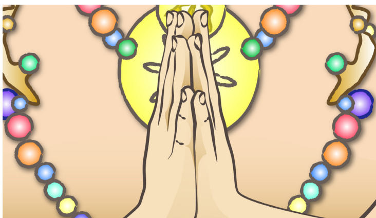
Mudra de la plegaria o Namaste mudra