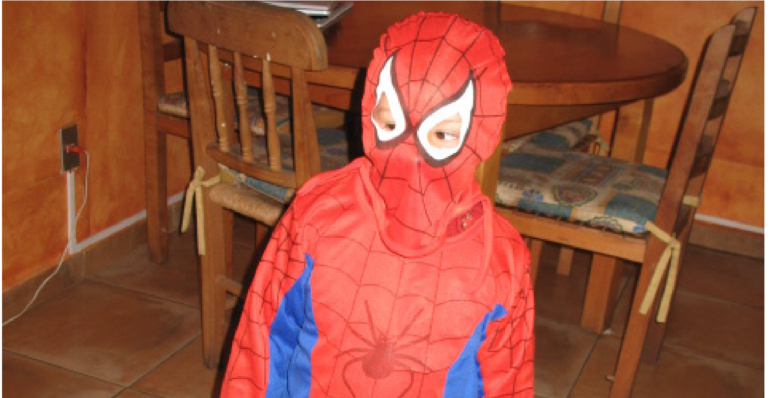
Niño Chileno disfrazado de Hombre Araña

En India como en Chile los niños sueñan con ser superhéroes.