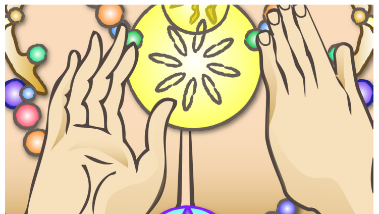
Abhaya: Significa No temer o mudra de la protección