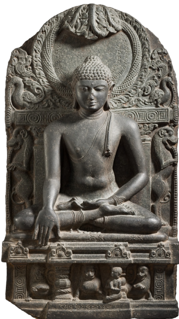
Imagen del Buda en la muestra

Pintar los gestos de las esculturas: Expresiones del rostro, gestos corporales, gestos de manos, posiciones del cuerpo y sugerir que dicen.