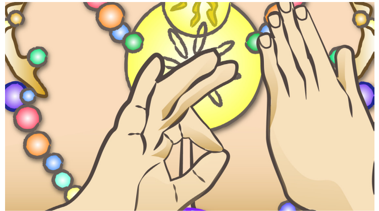
Vitarka mudra: es el gesto de la Enseñanza