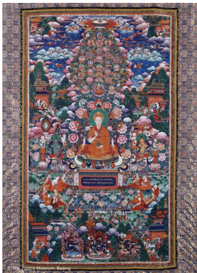
Pergamino del retrato del Emperador Qianlong como Manjushri en el Monasterio Puning Reinado de Qianlong (1735-1796) Tinta de color sobre tela Museo del Palacio Imperial

Entre los templos principales de la Ciudad Imperial, el Palacio de la Tranquilidad Terrenal estaba destinado a las ceremonias manchúes. Dos templos, uno en el jardín imperial y un segundo en el patio interior, estaban dedicados al culto taoísta, la religión originaria de China. El budismo sin embargo, tuvo siempre un lugar de enorme importancia y el patio interior de la Ciudad Prohibida contó con varios santuarios y templos dedicados a Buda. El emperador Qianlong por ejemplo, copiaba las escrituras budistas él mismo y muchas de las figuras de buda y de deidades tibetanas, así como la pintura tanka (buda de Tíbet) que aquí se exhiben, eran usadas en estos templos y constituyen una parte de las piezas traídas por los embajadores de Tíbet y Nepal como regalos para el Emperador.