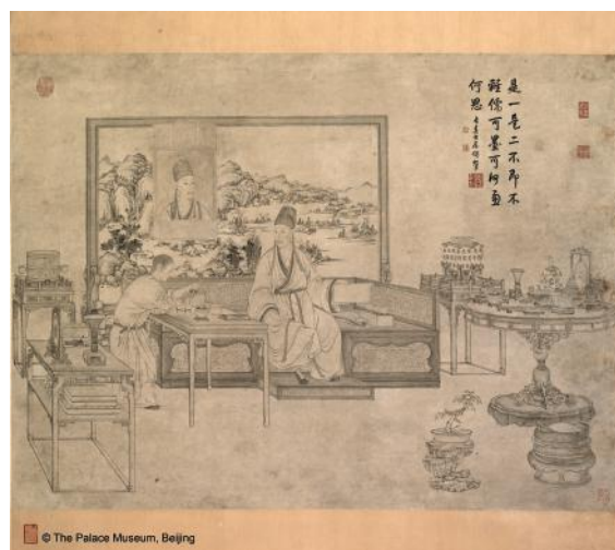
Pergamino colgante con pintura de Emperador Qianlong admirando antigüedades hecho por pintor Wenhan Yao

Qianlong en particular dedicó largo tiempo y esfuerzos a sus actividades académicas y obtuvo grandes logros intelectuales. Experto en el manejo del pincel y la tinta tanto en pintura como escritura, Qianlong era cercano a la poesía y la caligrafía. Organizó una enorme colección de textos clásicos chinos que