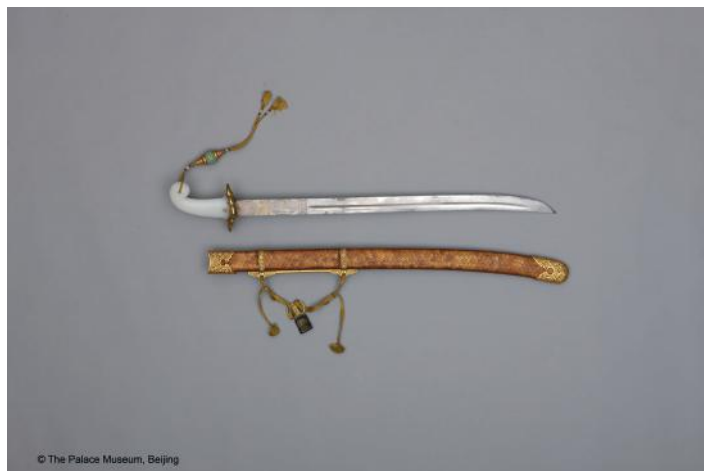
Sable de “filo frío” con empuñadura de jade y vaina de madera de duraznero dorada Reinado de Qianlong (1735-1796) Museo del Palacio Imperial

La guardia imperial era responsable de proteger a la Ciudad Prohibida, y además todos los príncipes chinos recibían formación ecuestre desde la infancia. Cada tres años se realizaban demostraciones militares donde se evidenciaba el poderío y disciplina de las fuerzas imperiales. En el control del territorio también participaba el emperador quién durante largos meses realizaba viajes a través de todo el país. Durante su mandato, Qianlong realizó seis de estos viajes de inspección por el territorio de China.