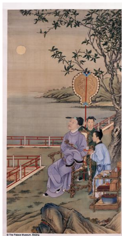
Pergamino de Emperador Qianlong contemplando la luna

Los hijos más jóvenes del emperador asistían a clases con los eruditos confucianos aprendiendo lengua china, caligrafía y filosofía. El que resultara emperador, debía tener un gran dominio de la palabra escrita, al igual que el resto de sus familiares que terminarían como funcionarios de gobierno.