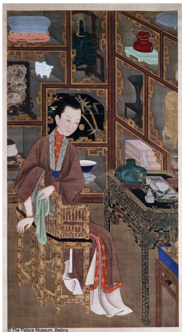
Pergamino colgante con dibujo de una dama (contemplativa)

Los peinados y gorros también estaban considerados dentro de la norma. Los sombreros semi-formales de los oficiales de la corte se diferencian según la estación. Los sombreros de invierno consisten en un gorro negro con borde de piel, y los de verano en forma de cono tejido y con borde de brocado de seda. Las coronas de ambos sombreros estaban cubiertas con una franja de color rojo de hilo de seda rematado por un botón que indicaba la posición del oficial.