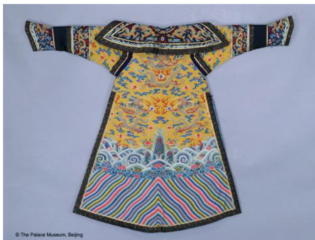
Vestidura real femenina con diseño de nubes y murciélagos elaborada con seda kesi Reinado de Jiaqing (1796-1820) Museo del Palacio Imperial

Cada uno de los trajes del emperador incluyó elaborados ornamentos con dragones, símbolo de su poder, representaciones de la cosmovisión china, y emblemas para la buena suerte. Los colores también tuvieron un significado y el amarillo estaba reservado para las celebraciones, el azul para asistir al Templo del Cielo, el rojo para el Templo del Sol y el azul claro para el Templo de la Luna. El “Manto del Dragón” de color amarillo, es el traje que el emperador usaba en festividades importantes y durante el Año Nuevo. Decorado con nueve dragones y once símbolos circulares de buen augurio, el manto del dragón traía suerte a los habitantes de China cada vez que el emperador lo usaba.