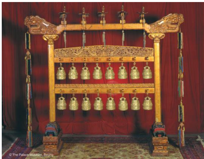
Instrumento de campanas de bronce dorado con diseño de dragones y nubes (con marco de madera)

Los lujosos interiores de la Ciudad se complementaron con la presencia sutil de las campanas, ocarinas y flautas. Según la leyenda, la música china se origina el año 2697 a. C. cuando el emperador ordena que sus súbditos trajeran cañas de bambú de las montañas para fabricar instrumentos y organizar las notas musicales básicas. De todas formas, la idea de que los sonidos podían darle armonía al universo, estaba profundamente arraigada en las creencias chinas y durante el largo período de influencia de Confucio, la música fue un medio para calmar las pasiones y asegurar la armonía. Toda composición musical debía estar dedicada a la purificación de la mente, y no a la entretención y el ocio. Así, la música más valorada era la más simple y etérea.