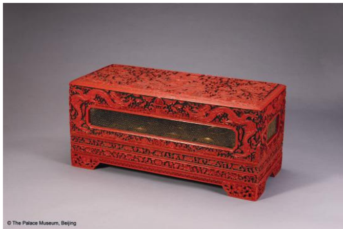
Caja rectangular de laca roja con diseño de dragones voladores Reinado de Qianlong (1735-1796) Museo del Palacio Imperial

la esencia de la cocina china, presentando hasta trescientos platos exóticos provenientes de todas partes de imperio; mongoles, tibetanos, han, manchúes y de otros grupos étnicos. Podían durar hasta tres días e incluir manjares exóticos y muy elaborados como carne de venado, dedo de camello, sopa de tortuga, pata de oso, sesos de mono, platos elaborados con rana, y leopardo entre muchos otros. Cada uno de los platos principales, abundantes y fastuosos, eran anunciados con gran pompa con el sonido del gong. Sus nombres de fantasía contribuían a evocar la belleza de las distintas provincias que formaron parte del imperio, dando cuenta del poder imperial y de la majestuosidad de la Ciudad Prohibida.