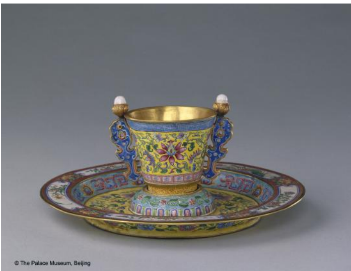
Taza y platillo de oro y cloisonné Reinado de Qianlong (1735-1796) Museo del Palacio Imperial

También tiene una vasta colección de cerámicas que incluyen desde la alfarería pintada con negro o con colores en el Periodo Neolítico hasta los distintos estilos que destacaban a cada dinastía, por ejemplo, “los Cinco Hornos Famosos” de la dinastía Song ; la porcelana azul y blanca de la dinastía Yuan ; la porcelana blanca, el vidriado rojo y las técnicas de contraste de colores utilizados en la dinastía Ming y también la técnica de esmaltado en colores usado en la dinastía Qing .