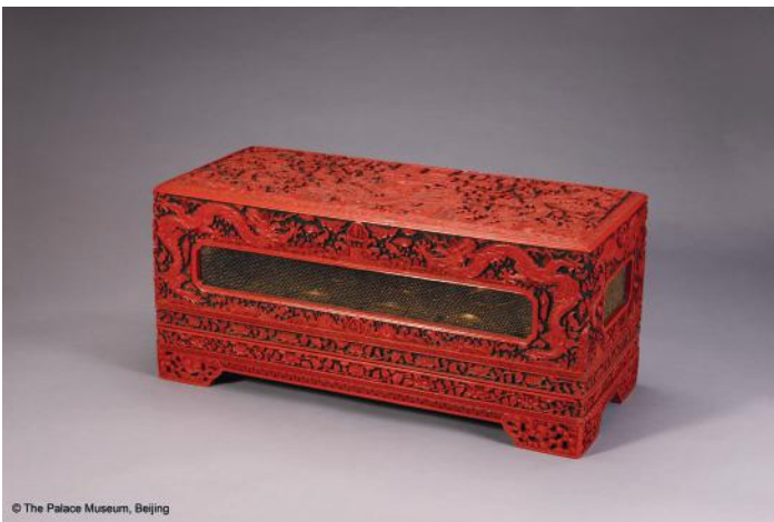
Caja rectangular de laca roja con diseño de dragones voladores Reinado de Qianlong (1735-1796) Museo del Palacio Imperial

la esencia de la cocina china, presentando hasta trescientos platos exóticos provenientes de todas partes de imperio; mongoles, tibetanos, han, manchúes y de otros grupos étnicos. Podían durar hasta tres días e incluir manjares exóticos y muy elaborados como carne de venado, dedo de camello, sopa de tortuga, pata de oso, sesos de mono, platos elaborados con rana, y leopardo entre muchos otros. Cada uno de los platos principales, abundantes y fastuosos, eran anunciados con gran pompa con el sonido del gong. Sus nombres de fantasía contribuían a evocar la belleza de las distintas provincias que formaron parte del imperio, dando cuenta del poder imperial y de la majestuosidad de la Ciudad Prohibida.