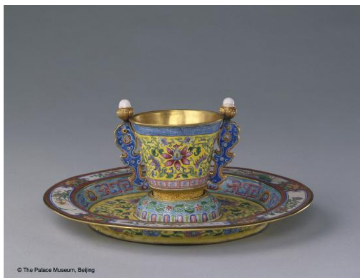
Taza y platillo de oro y cloisonné Reinado de Qianlong (1735-1796) Museo del Palacio Imperial

palacio de todos. En 1912, fue la abdicación de Puyi , el último emperador de China, pero bajo un acuerdo con el nuevo gobierno de la República de China, Puyi residió dentro de la Ciudad Prohibida. Después de 12 años, Puyi fue expulsado tras un golpe de estado en 1924 y luego un comité conformado por representantes del palacio de la dinastía Qing fue designado para revisar las posesiones que quedaron. El 10 de octubre de 1925, el Museo del Palacio se fundó formalmente, y la Ciudad prohibida fue por primera vez abierta para todo público.