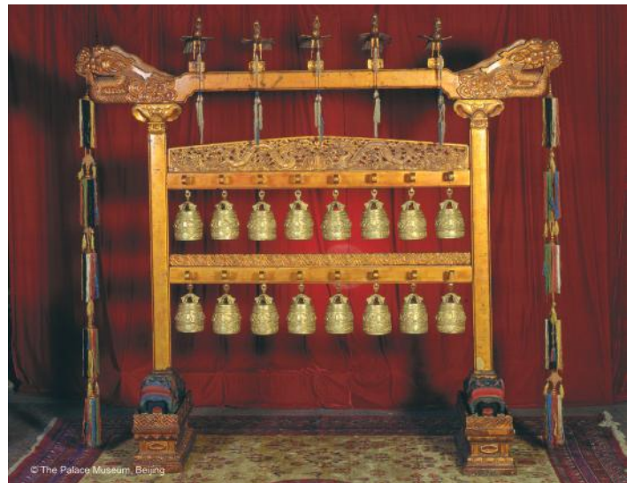
Instrumento de campanas de bronce dorado con diseño de dragones y nubes (con marco de madera)

Los lujosos interiores de la Ciudad se complementaron con la presencia sutil de las campanas, ocarinas y flautas. Según la leyenda, la música china se origina el año 2697 a. C. cuando el emperador ordena que sus súbditos trajeran cañas de bambú de las montañas para fabricar instrumentos y organizar las notas musicales básicas. De todas formas, la idea de que los sonidos podían darle armonía al universo, estaba profundamente arraigada en las creencias chinas y durante el largo período de influencia de Confucio, la música fue un medio para calmar las pasiones y asegurar la armonía. Toda composición musical debía estar dedicada a la purificación de la mente, y no a la entretención y el ocio. Así, la música más valorada era la más simple y etérea.