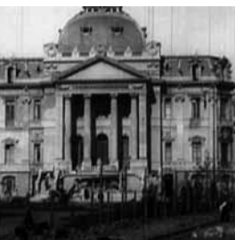
Foto capturada del film Inauguración del Palacio de Bellas Artes, 1910

restos mientras se espera la hora de su repatriación” 3 . Hecho que sólo ocurrirá en febrero de 1911, a bordo del Buque Blanco Encalada, barco especialmente designado para esta misión.