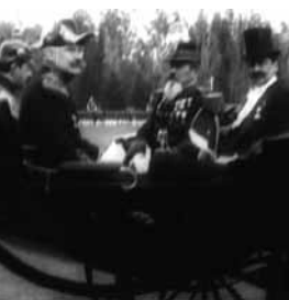
Foto capturada del film Gran revista militar en el parque Cousiño , 1910

Además, se hace costumbre que un pianista apoye las funciones. Junto con él, se irán incorporando otros músicos hasta llegar a ser frecuentes en los grandes estrenos una orquesta, convirtiéndose en parte fundamental de las exhibiciones, de allí su fervorosa protesta con el advenimiento del cine sonoro a fines de la década de los veinte.