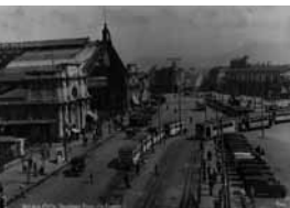
Santiago, Estación Central Enrique Mora Ferraz

En los primeros registros documentales, el énfasis está en mostrar la vida de aristócratas, militares, autoridades civiles y religiosas, sus ritos cotidianos, fiestas y eventos sociales. El Centenario de la República fue, sin duda, foco de interés. Hoy podemos ver fragmentos de las celebraciones: Gran revista militar en el Parque Cousiño (Revista militar de 1910) ; Revista naval en Valparaíso o Gran revista naval, 1ª y 2ª Parte ; Inauguración del Palacio de Bellas Artes (fragmentos) e imágenes de fiesta popular; presumiblemente también en el Parque Cousiño. En la línea de la vida cotidiana y social, se conservan fragmentos de Un paseo a Playa Ancha (1903) ; La exposición de animales (o la Vista de la Quinta Normal) (1907) y Gran paseo campestre en el fundo del señor Francisco Undurraga (1910) .