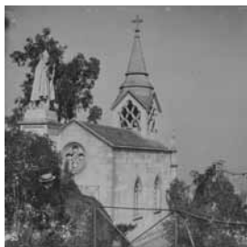
Cerro Santa Lucía, 1905 Obder Heffer

Impulsamos el año 2006 una campaña de rescate audiovisual que ha contado con una activa participación del sector audiovisual, de la comunidad nacional y de los archivos internacionales que han colaborado en la búsqueda, identificación y repatriación de nuestras películas. Aquí presentamos parte de nuestro acervo.