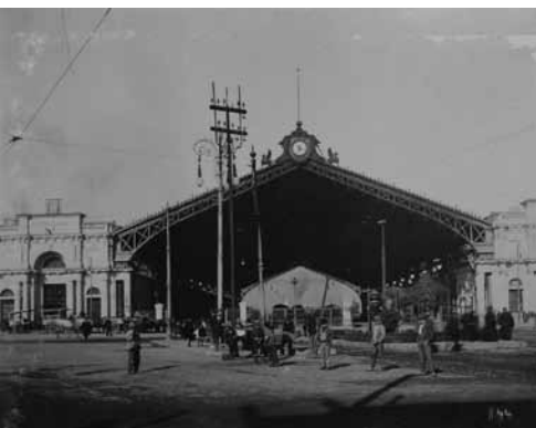
Santiago, Estación Central, 1910