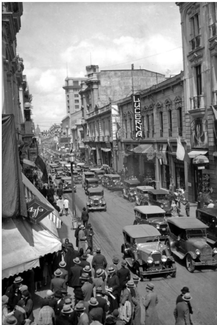
Calle Ahumada 1930 Enrique Mora Ferraz.