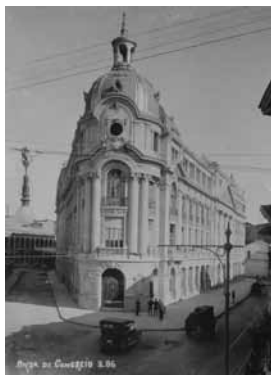
Bolsa de Comercio, 1920