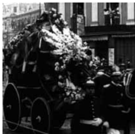
Fotos capturadas del film Los funerales del Presidente Montt , 1911

2.- El Diario Ilustrado , Santiago, 27 de agosto de 1910.