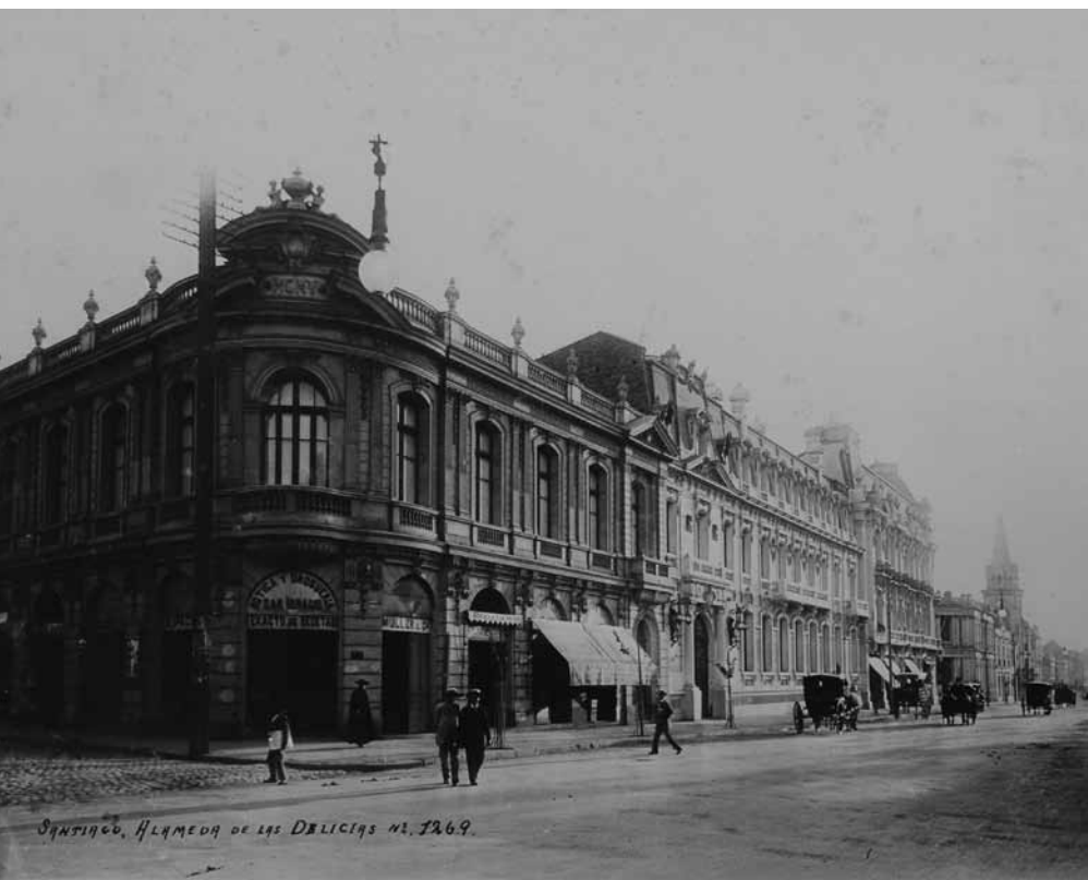
Santiago, La Alameda de las Delicias, 1905 Obder Heffer