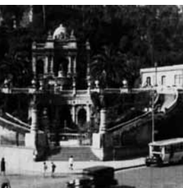
Foto capturada del film El Cerro Santa Lucía , 1929

El periodo entre 1889 y 1900 tanto en Chile como en Latinoamérica fue un momento de grandes cambios. El proceso de modernización agigantado, la diversificación sociocultural y la vinculación con mercados externos sugieren tensiones y desafíos. Se trata de un periodo de apropiaciones culturales entre las que destaca el naturalismo, el modernismo, corrientes parnasianas en literatura; el positivismo, el evolucionismo, entre otras cosas. En lo cotidiano, destaca el afrancesamiento y "la Belle époque" criolla. 3 Inmediatamente después, entre 1900 y 1930 se vive "un nuevo y activo proceso de construcción intelectual y simbólica de la nación", que se expresa a través de los rituales del Centenario. Imágenes como los registros que presentamos son elocuentes. Por un lado, las conmemoraciones oficiales giran entorno a la élite criolla, a las visitas ilustres y a los actos solemnes, pero también se incluyen escenas que incorporan a sectores populares, como las celebraciones en el Parque Cousiño. Llama la atención aquí la inclusión de el baile de la cueca, en imágenes que podemos hacer dialogar con Un paseo a Playa Ancha (1903), la más antigua película que hoy se conserva, donde la cultura popular y la vida cotidiana adquieren especial relevancia.