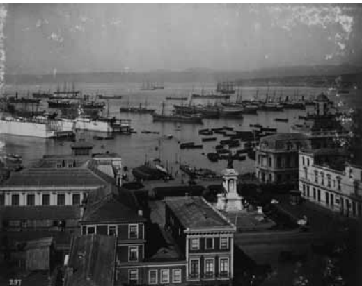
Valparaíso, 1905 Obder Heffer

Las primeras funciones del cinematógrafo Lumière realizadas en 1896 en nuestro país tuvieron un éxito explosivo, lo que llevó a una gran proliferación de equipos de diversas marcas y calidades.