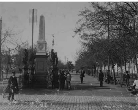
La Alameda, 1910 Obder Heffer

Chile fue uno de los países donde se conoció la experiencia del cine muy tempranamente y los primeros registros, documentales y ficciones, se inspiraron en modelos extranjeros, pero buscaron muy pronto mostrar los sucesos sensacionales y poner en relieve la idea de un país que entraba a la modernidad.