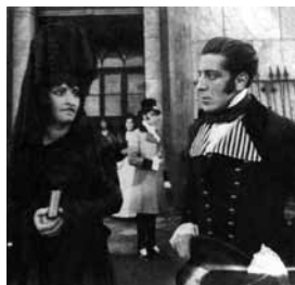
El húsar de la muerte, 1925