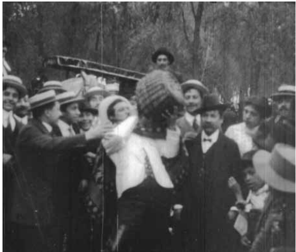
Festejos del Centenario, 1910